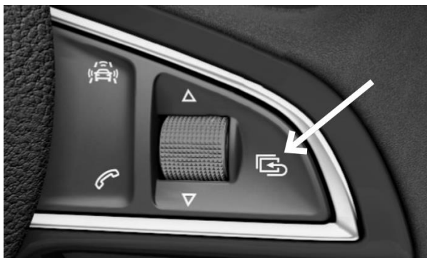
Клавиша “Возврат на предыдущую страницу”