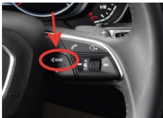
Кнопка «NAV» на руле